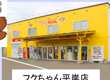
フクちゃん平岸店