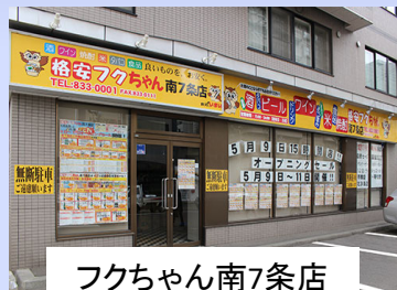
フクちゃん南7条店