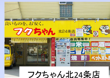
フクちゃん北24条店