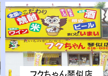
フクちゃん琴似店